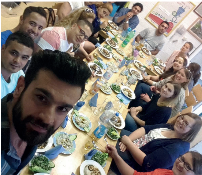
Das vom Sozialdienst katholischer Frauen Ibbenbüren organisierte Willkommensdinner wurde zahlreich besucht. Beim gemeinsamen Essen lernten sich „alte“ und „neue“ Ibbenbürener kennen.